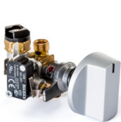
Rubinetto gas professionale