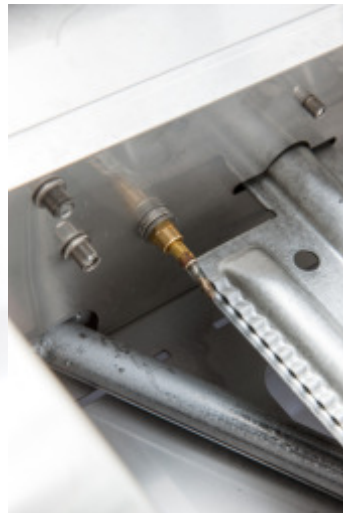
Termocoppia di sicurezza che blocca l'uscita del gas se un colpo di vento spegne la fiamma