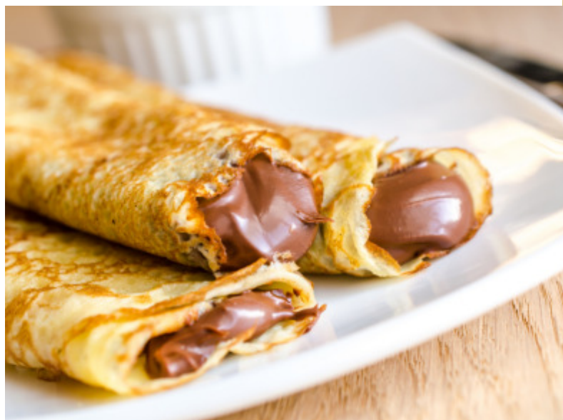
CREPES AL CIOCCOLATO

I barbecue elettrici Airone hanno risolto questo problema perché sono costruiti con resistenze elettriche molto particolari. Utilizzano infatti delle resistenze rettangolari che riescono a trasmettere il calore in maniera molto più efficiente su tutta la superficie della griglia ed inoltre usano lo stesso materiale che viene utilizzato nel settore aerospaziale per limitare al massimo la dispersione di calore.