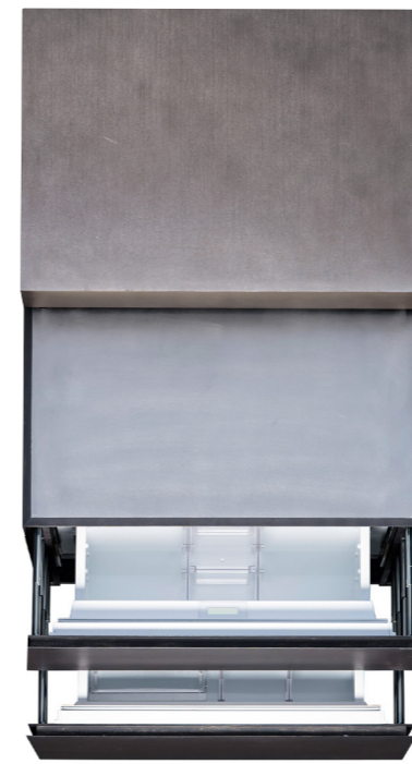
Kühl- und Gefrierelement mit Eiswürfelbereiter Fridge/freezer element with an ice maker