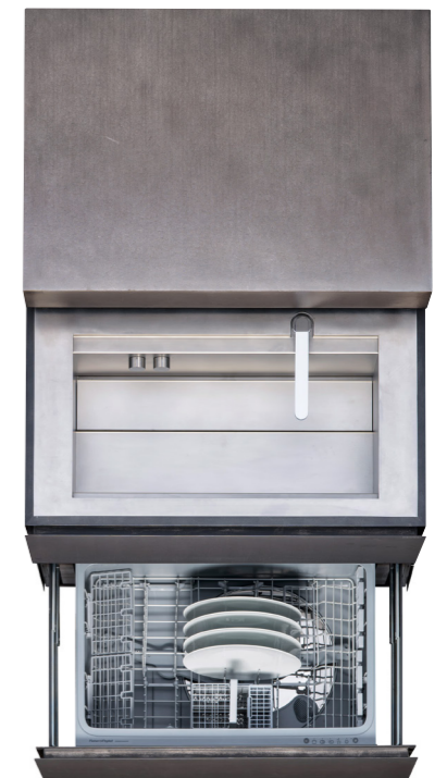
Spüle und Ladengeschirrspüler Sink and dishwasher drawer