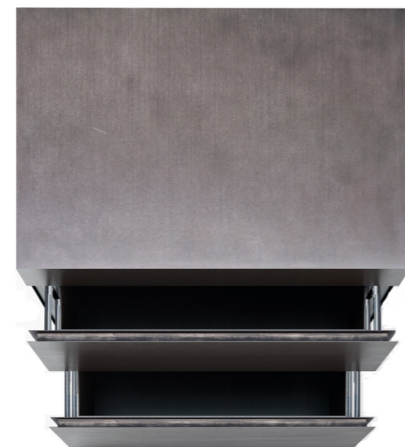
Stauraum für Kochutensilien Storage space for cooking utensils