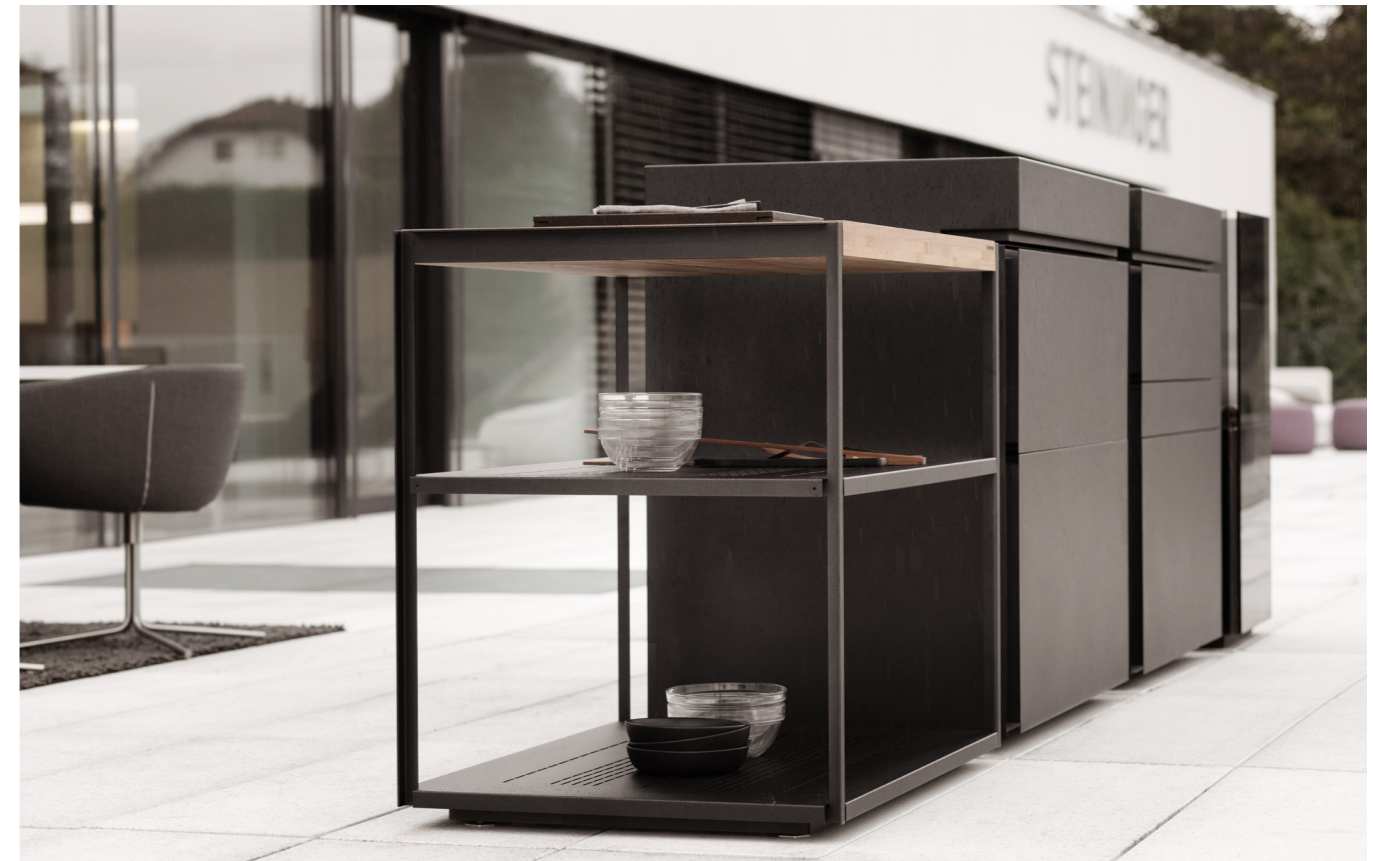
Regalelement mit witterungsbeständiger Teakholzarbeitsplatte Shelf element with a weather-resistant teak counter top

The perfect addition to your outdoor kitchen! The ROCK.AIR SHELF connects flush with the other kitchen modules and thus extends your radius of action. Equipped with a worktop made of massive teak wood and a powder-coated surface to withstand both wind and weather.