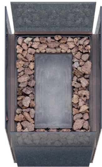
Kleine Brennstelle mit Gasfeuer oder Brenngel Small burner with gas fire or lighting gel