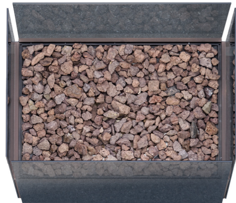
Große Brennstelle mit Gasfeuer oder Brenngel Large burner with gas fire or lighting gel