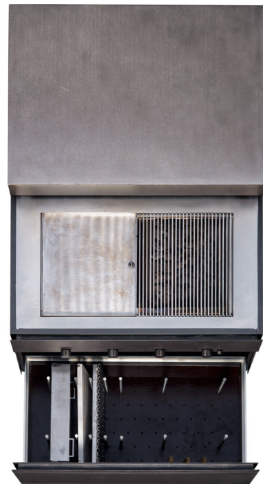
Kochelement mit Gasgriller und unterschiedlichen Einsätzen Cooking element with a gas barbecue and various inserts